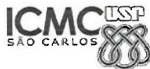
PRÓ-REITORA DE CULTURA E EXTENSÃO UNIVERSITÁRIA MARLI QUADROS LEITE